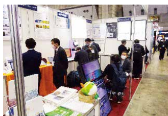
ネプコンジャパン