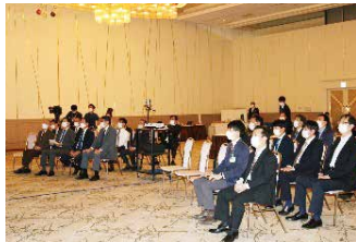
オンライン商談会

台湾電子設備協会との相互交流を継続し、更には他協会との交流を進めていくことで台北市等へのビジネス拡大を図っていく。あわせて、中国市場への販路開拓に向け、武漢市および上海市の各団体等との交流を深めていく。